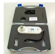
マイクロ CO モニター