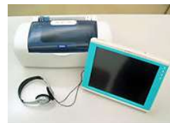
もの忘れ相談プログラム