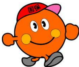
宮崎県国民健康保険 イメージキャラクター 「オレンジくん」